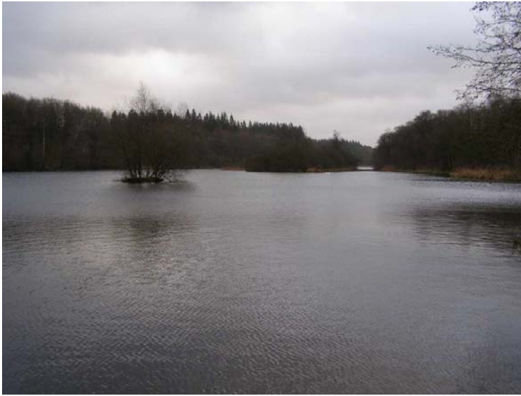
Elværksøen set fra turbinebygningen, og herunder set selve bygningen set fra travestien på Højmarkssiden